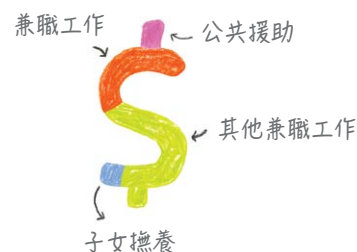
計算收入以供申請用