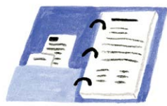
가계 예산 책정