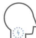
Mal di gola