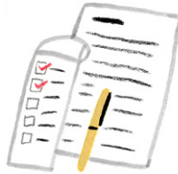
Redwi dèt ou