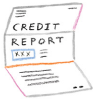
Amelyore kredi ou

Si w ap chèche yon apatman ki pa twò chè, kite nou ede ou: