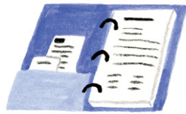
Kreye yon bidjè pou kay ou