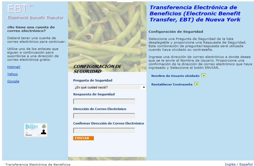
Transferecia Electrónica de Beneficios