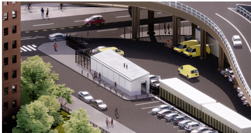
Representación de la futura construcción de la puerta interceptora.

El edificio de la puerta interceptora, que albergará a los mecánicos que operan la puerta interceptora para las mejoras del sistema de alcantarillado, se construirá en Robert F. Wagner Sr. Pl. en South St.