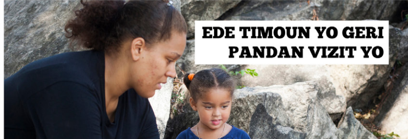
ENTÈVYOU AK PARAN KI TE NAN SISTÈM BYENNÈT TIMOUN NAN POU PARAN KI NAN SISTÈM NAN