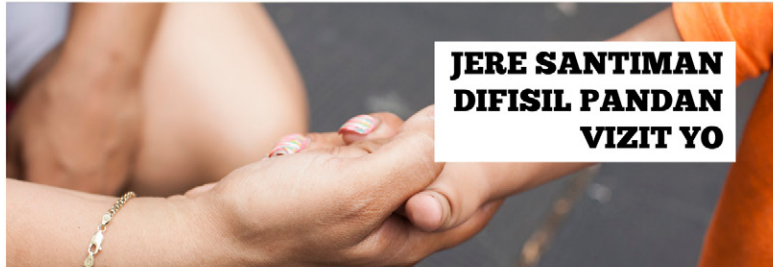
KONSÈY PARAN KI TE NAN SISTÈM BYENNÈT TIMOUN NAN POU PARAN KI NAN SISTÈM NAN