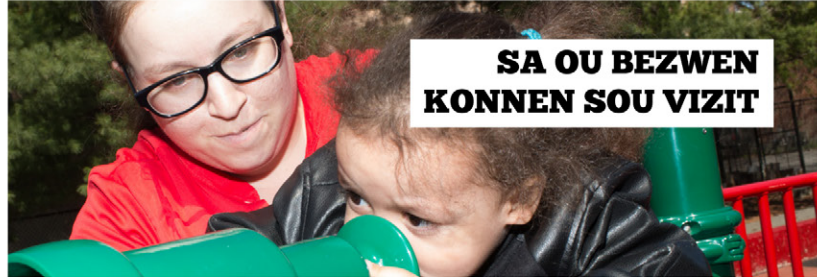
KONSÈY PARAN KI TE NAN SISTÈM BYENNÈT TIMOUN NAN POU PARAN KI NAN SISTÈM NAN