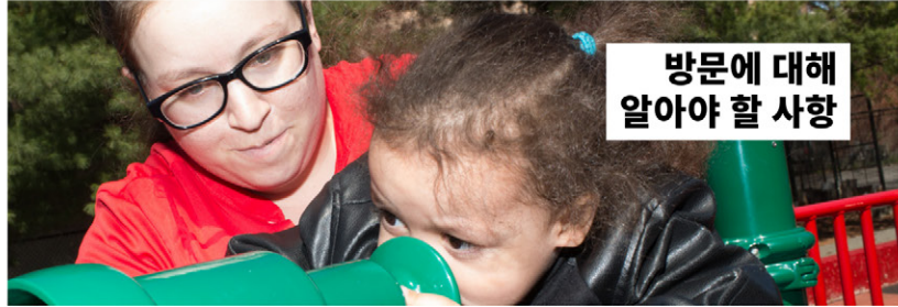
아동 복지 시스템에서 부모에 대하여