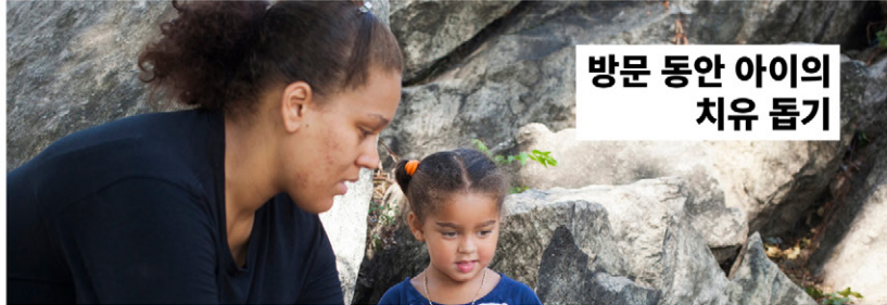
방문 동안 아이의 치유 돕기