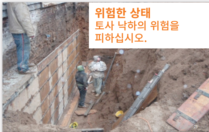
위험한 상태 토사 낙하의 위험을 피하십시오.

사용하지 않는 자재는 가장자리와 개구부로부터 떨어진 곳에 보관해야 합니다.