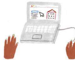
하우징 커넥트 (Housing Connect)로 주택 추첨 신청