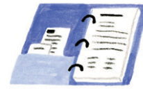
중요 정보 수집