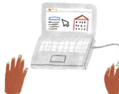
하우징 커넥트 (Housing Connect)로 주택 추첨 신청