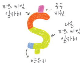
주택을 위한 소득 계산