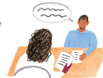
자격 증명 준비