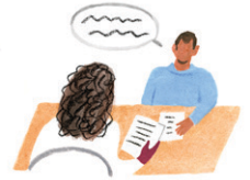
자격 증명 준비