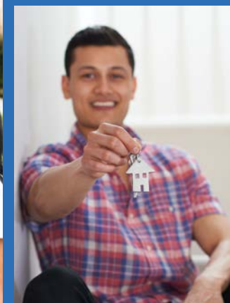
ФОТОГРАФИИ И СПОРТЗНАКИ ИСКЛЮЧИТЕЛЬНО В ИЛлюСТРАТИВНЫХ ЦЕЛЯХ. А ИЗМЕНЯЕМЫЕ НА НИХ ЛИЦА ЯВЛЯЮТСЯ МОДЕЛЯМИ.