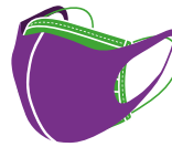
Mask Jetab + Kouvèti pou Figi an Twal