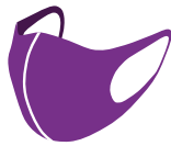
Kouvèti pou Figi an Twal