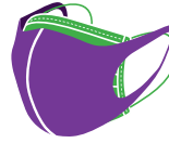
Maseczka jednorazowa + osłona twarzy z tkaniny