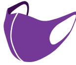
Osłona twarzy z tkaniny