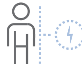
Doulè nan kò