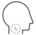
Mal de gorge