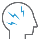
Dolores de cabeza