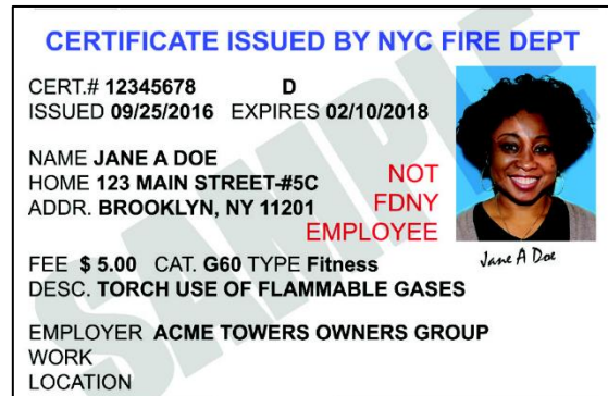
Образец карты Certificate of Fitness (COF)

*** По выходным наш офис не работает. Если у вас не получается прийти на экзамен в часы, когда предварительная запись не требуется, запишитесь по номеру 718-999-1988.