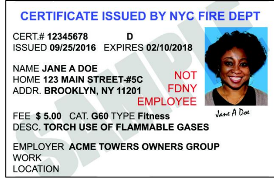
Certificate of Fitness (COF) কার্ডের নমুনা

*** ছুটির দিন আমাদের অফিস বন্ধ থাকে। যদি আপনি কার্য সময়ে আসতে না পারেন তাহলে 718-999-1988 এ ফোন করে একটি অ্যাপয়েন্টমেন্ট স্থির করুন।