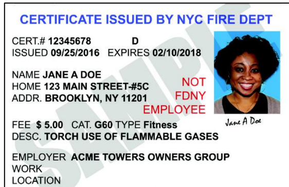
Egzanp Kat Certificate of Fitness, COF la.

*** Biwo nou fèmen nan jou konje yo. Si ou pa ka vini lè ou pa bezwen randevou yo, rele 718-999-1988 pou pran yon randevou.