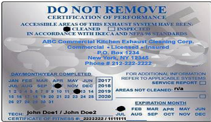
維修公司完成維修後會在抽油煙機上貼上的標籤。