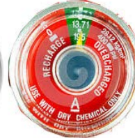
PAF pa bezwen recharge