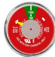
PFE bezwen recharge