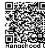
Rangehood QR Code

Avan konpayi a kòmanse travay la, mande pou montre ou nouvo viyèt konfòmite pou ot aspirant la. Se sèlman konpayi FDNY apwouve yo ki ka kòmande nouvo viyèt ak so COF yo. Eskane kòd QR a avan ou itilize konpayi antretyen an pou w ka sèten FDNY toujou apwouve li.