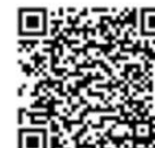
Rangehood QR Code