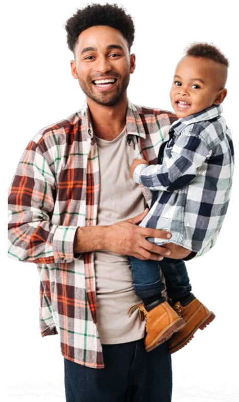
Photo for illustration purposes only. The people shown are models.