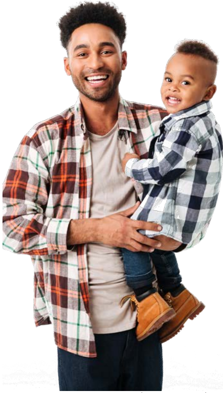
الصورة لأغراض التوضيح فقط. الأشخاص الظاهرون هم عارضون.