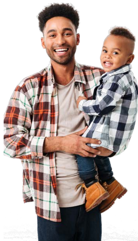
Photo for illustration purposes only. The people shown are models.