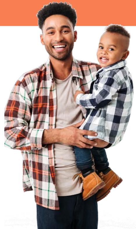
Las fotografías son únicamente para fines ilustrativos. Las personas que aparecen en ellas son modelos.