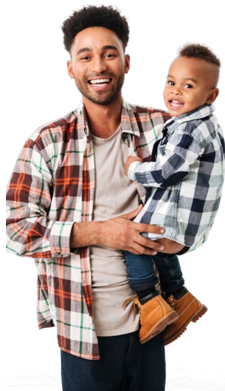
Photo for illustration purposes only. The people shown are models.