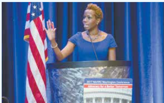
La Presidenta de NYCHA Shola Olatoye se dirige a líderes de la vivienda en Washington, D.C.

Las autoridades de vivienda pública y los administradores de vivienda han adoptado la inversión privada no como último recurso, sino como un puente a un modelo económico del siglo XXI. En el momento en que la vivienda pública se enfrenta a un cambio fundamental en su financiación, los programas (CONTINÚA EN LA PÁGINA 5)