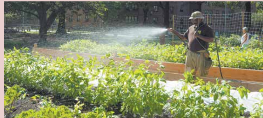
Miembro del cuerpo Green City Force riega los vegetales en la finca del residencial Bay View Houses en Brooklyn.

Urban Farms en NYCHA forma parte de Building Healthy Communities, un programa dedicado a mejorar la salud en 12 vecindarios de la ciudad de Nueva York.