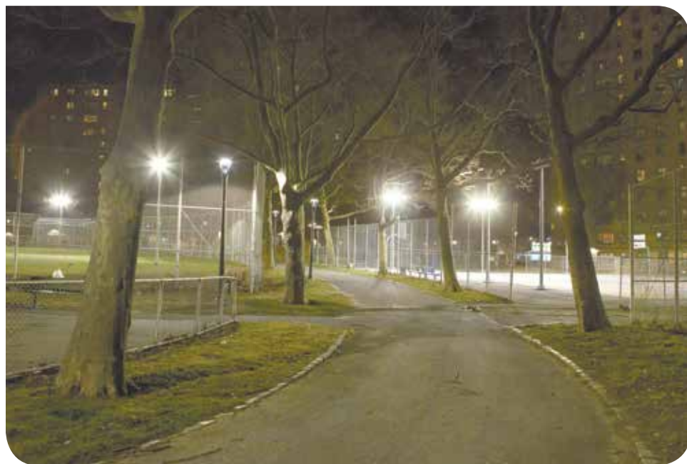
La nueva iluminación en Castle Hill Houses en el Bronx ha ayudado a los residentes a sentirse más seguros al caminar por su residencial por la noche.