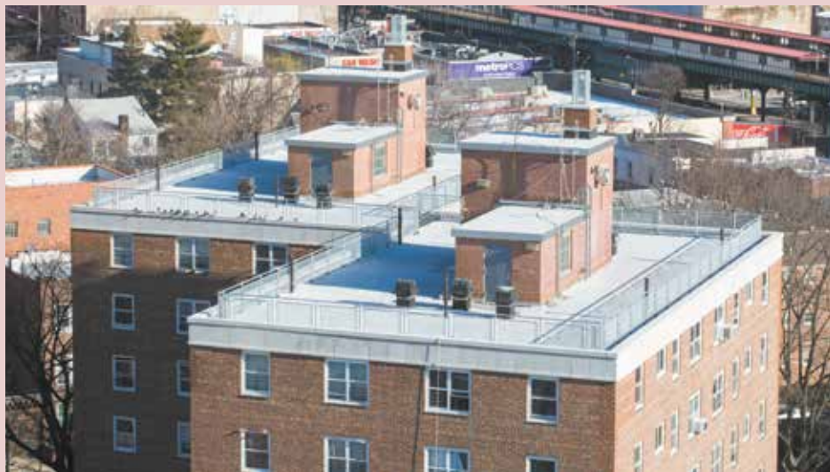
Un techo renovado en el Residencial Parkside Houses.

actualizaciones fundamentales a la infraestructura son esenciales mientras continuamos implementando NYCHA de Nueva Generación, nuestro plan estratégico a largo plazo para crear viviendas públicas seguras, limpias y conectadas".