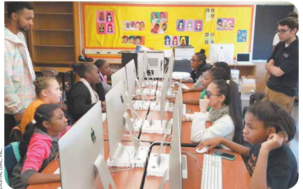
DIGITAL GIRL, INC.

Estudiantes aprendiendo habilidades valiosas de codificación que les abrirán muchas puertas profesionales en el futuro.