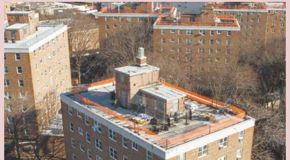
Techos actualmente en proceso de renovación en el Residencial Parkside Houses.