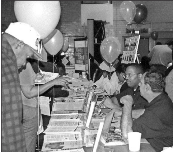
(arriba) Más de 150 residentes de viviendas privadas y públicas asistieron a la Feria de Propietarios de Vivienda de Far Rockaway, co-auspiciada por NYCHA, Fannie Mae, el congresista de los Estados Unidos Gregory Meeks y miembros del Comité With Ownership, Wealth (WOW). (Abajo) Jóvenes del Programa de Audio Ocean Bay se unen a dos miembros del personal de NYCHA para la foto.