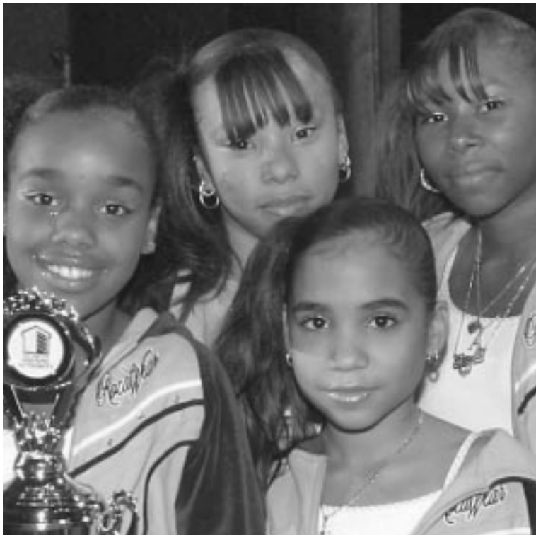
2 Hot 2 Handle es el nombre de este grupo de orgullosas bailarinas del residencial Bronx River Houses. Ellas ganaron el segundo lugar en la súper competitiva categoría de 6 a 15 años.