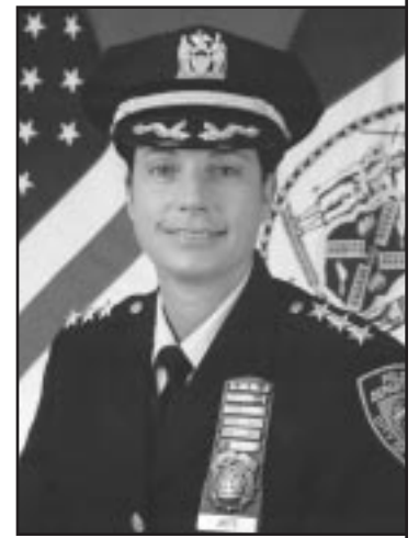
Jefa del Buró de Policías de la Vivienda

El Departamento De Policías De La Ciudad De Nueva York (NYPD) Desea Que Esta Temporada Festiva Sea Una Feliz Y Segura Para Todos Los Residentes De La Autoridad De La Vivienda De La Ciudad De Nueva York. Porque muchos de nosotros estamos preocupados con las compras y la planificación para los días feriados, las precauciones de seguridad de todos los días a veces se nos olvida. Los siguientes consejos son proveídos como recordatorio para que tengan una temporada festiva segura.