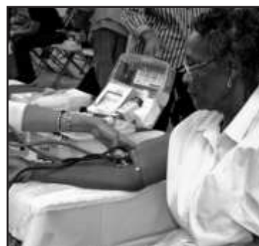
A una Señora se le toma la presión arterial durante la Feria.