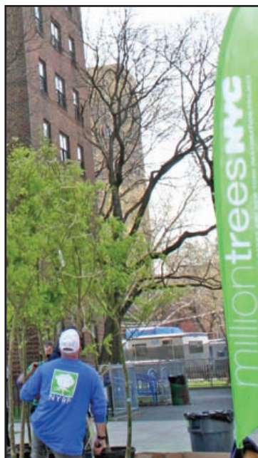
Los voluntarios sembraron 282 arboles en Wagner Houses.