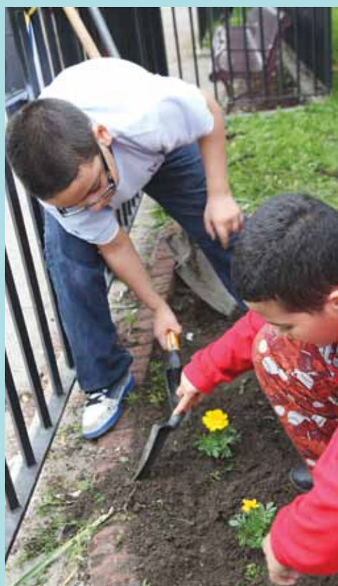
Jóvenes de NYCHA siembran flores el 23 de mayo de 2011 en un evento comunitario celebrado por el Comité Ecológico de Residentes de Ravenswood Houses.

Si usted está interesado en poner un anuncio en El Periódico , favor de llamar a nuestros representantes de marketing de la Oficina de Desarrollo Empresarial y de Ingresos al (212) 306-6616. La inclusión de cualquier anuncio en El Periódico de NYCHA no constituye respaldo de parte de NYCHA, del anunciante, o sus productos. NYCHA no garantiza la calidad de los productos o servicios disponibles del anunciante.