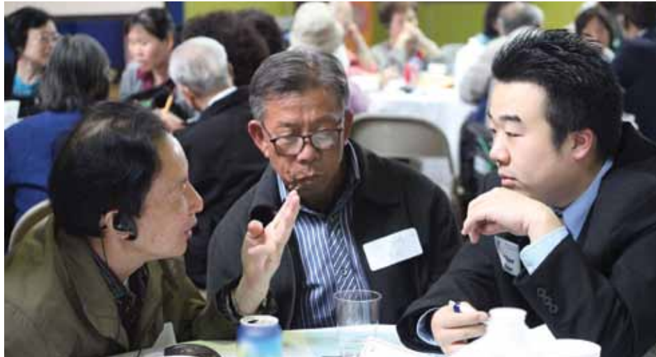
Residentes y personal de NYCHA discuten el futuro de la Autoridad y cómo lo lograrán juntos durante la Conversación Comunitaria del 14 de mayo de 2011 en el Centro Comunitario de Rutgers en Manhattan.

Las Conversaciones Comunitarias fueron una de las piezas finales del rompecabezas que dará forma al Plan para Preservar la Vivienda Pública, el plan comprehensivo de NYCHA que servirá de guía para los próxi-