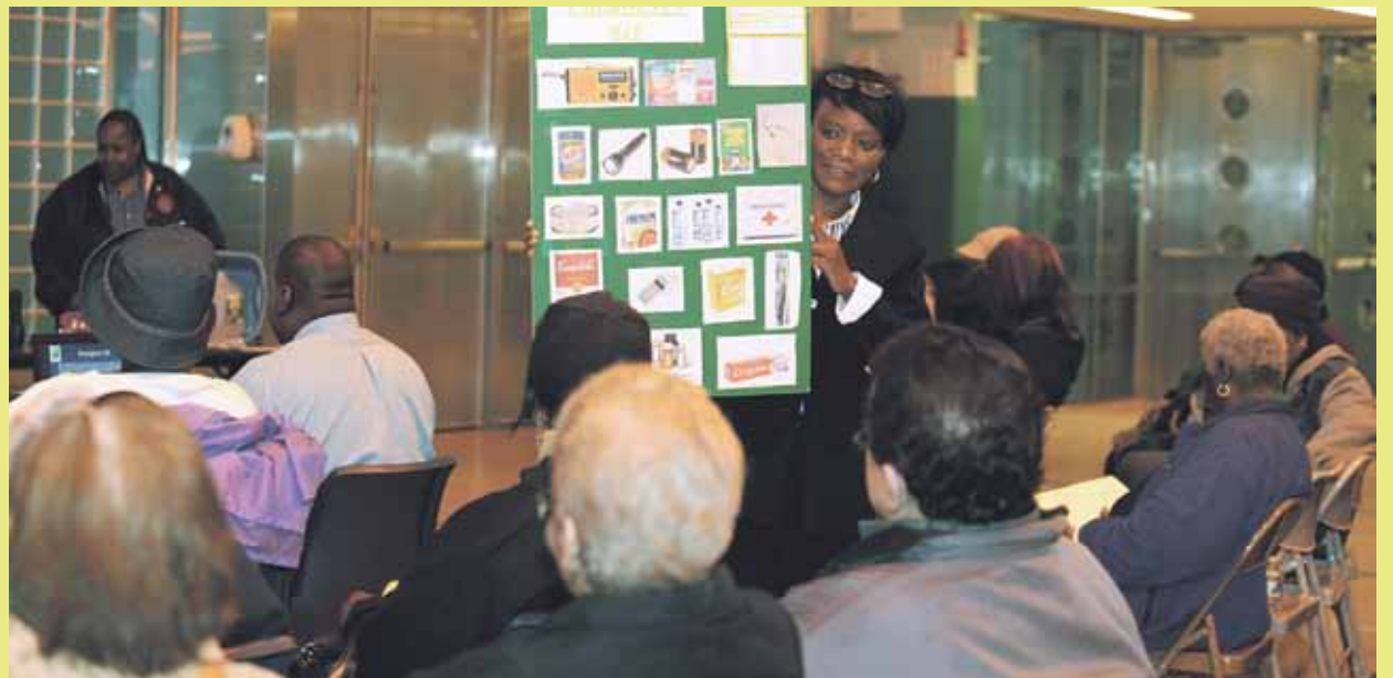
Se le muestra a los residentes algunos de los artículos que deben tener en su kit de emergencia para tener en el hogar en caso de una emergencia. Éstos incluyen un radio operado por baterías, agua embotellada y pasta dental.

El director de Servicios de Emergencia, Conrad Vázquez, resaltó que lo más importante es hacer un plan que incluya identificar el lugar en el que las familias se reunirán después de un desastre, designar a un amigo o familiar que no esté dentro el estado para llamarlo si se separan durante un desastre e identificar todas las posibles rutas de salida. También es importante preparar un bolso de emergencia que se pueda llevar fácilmente con elementos esenciales, como agua embotellada, alimentos no perecederos, copias de documentos importantes en un contenedor a prueba de