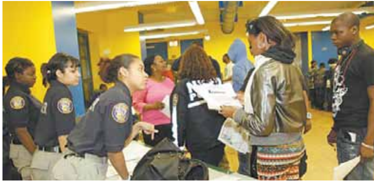
Los jóvenes reunidos en el Centro Comunitario Louis Armstrong hablan sobre la seguridad.

La Oficina de Sustentabilidad y Fortalecimiento Económico del Residente (REES, por sus siglas en inglés) se reunirá con residentes para ponerlos al tanto de la Academia de Capacitación de Residentes de NYCHA, la cual brinda capacitación laboral y oportunidades de empleo, dos