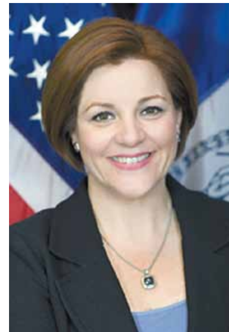
Christine C. Quinn, Presidenta del Consejo Municipal

Estos fondos del Consejo Municipal serán útiles para dar forma a una solución innovadora que ayudará a mantener y mejorar la infraestructura de las viviendas asequibles de NYCHA, a la vez que creará nuevos empleos con opciones de carreras profesionales para residentes de viviendas públicas. El proyecto incrementará de manera considerable la cantidad de órdenes de trabajo de mantenimiento y reparaciones que se completarán por año, con la contratación de residentes cualificados de NYCHA y la promoción de empleados que actualmente residen en NYCHA para ayudar a los trabajadores de