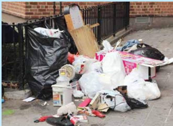
La basura de los residentes se acumula en la acera, atrayendo roedores en el Lower East Side.

Cuando los residentes no dejan la basura en la zona correspondiente, se crea un problema que afecta a todos los que viven y también a los que trabajan en NYCHA. Dejar basura en el pasillo, el hueco de la escalera, el vestíbulo, el ascensor o frente al edificio no sólo es desagradable a la vista, sino que también atrae ratas y ratones. Arrojar basura en estos lugares puede causar problemas graves, tales como lesiones a los empleados de limpieza, quienes trabajan para limpiar y mantener los edificios de NYCHA.