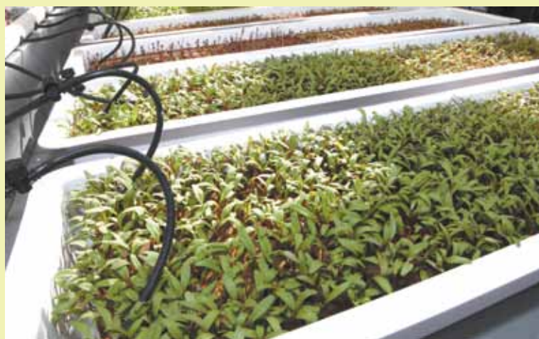
La granja en el techo de Arbor House incluye hierbas aromáticas, frutas y vegetales para los residentes y miembros de la comunidad.

El veinticinco por ciento de los apartamentos se reservarán para residentes de NYCHA y personas en la lista de espera de NYCHA. Además, hay más de 40 lugares de estacionamiento subterráneo en el lugar que los residentes tendrán prioridad para alquilar mensualmente. "La construcción de proyectos innovadores como el complejo Arbor House resultan esenciales para