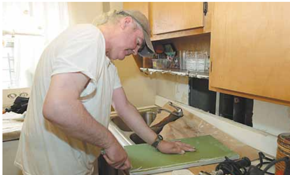
Un empleado de mantenimiento de NYCHA realiza reparaciones en una cocina en el Residencial Patterson Houses.

NYCHA está abordando este asunto con un nuevo y dinámico Plan de Acción. El objetivo es eliminar la acumulación de 420,000 órdenes de trabajo en curso para fines de 2013. "NYCHA comprende y respeta la frustración de los residentes con respecto a las demoras en las actividades de mantenimiento y reparación", afirmó el Presidente de NYCHA, John B. Rhea, para agregar que "a pesar de las limitaciones de nuestro presupuesto, tenemos la responsabilidad de trabajar mejor y más eficazmente con los recursos que tenemos. Por ello, agilizar las tareas de manteni-