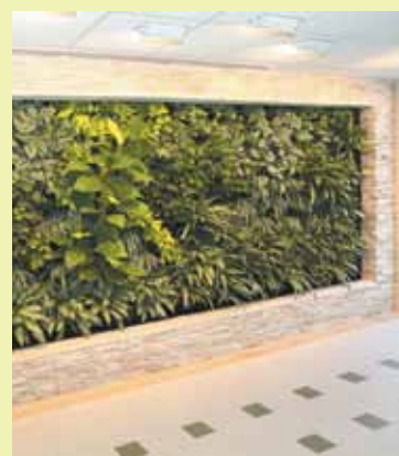
El vestíbulo de Arbor House incluye una pared viva.

comunidad hierbas aromáticas, frutas y vegetales frescos, locales, libres de agroquímicos, los doce meses del año, y creará un modelo nacional para la producción de alimentos sustentables", explicó Robert Fireman, Presidente de Sky Vegetables.