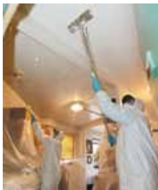
Contratistas de NYCHA llevan a cabo tareas de eliminación de humedad en el Residencial La-Guardia Houses después del huracán Sandy.

Han pasado casi seis meses desde que el huracán Sandy azotó la ciudad de Nueva York y aún continúan los esfuerzos de recuperación. Durante los últimos dos meses, la Unidad de Proyectos de Capital de NYCHA ha puesto todo su empeño en asegurar que los residentes que viven en Coney Island, Red Hook y los Rockaways vuelvan a tener una vida normal. Esto incluyó reemplazar los generadores que operan las calderas portátiles con transformadores eléctricos, lo que mejoró la confiabilidad del servicio de calefacción y agua caliente.