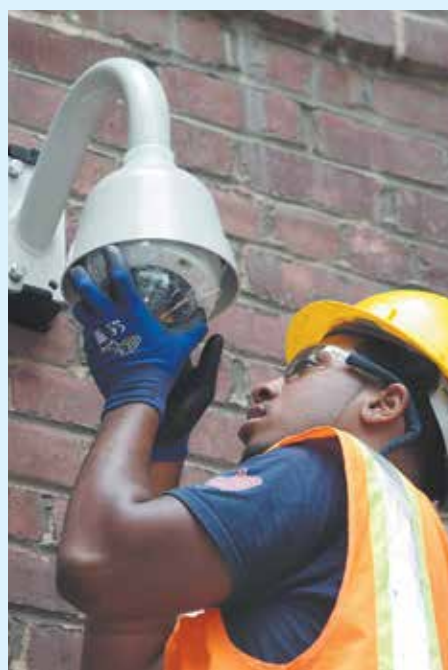
Un empleado de NYCHA instala una cámara de seguridad CCTV.

Las ubicaciones de las cámaras se eligen según las sugerencias de los residentes, en colaboración con NYCHA y el Departamento de Policía de la Ciudad de Nueva York (NYPD, por sus siglas en inglés). Estas se colocan para monitorear áreas importantes, tales como las entradas de los edificios, esquinas en las calles, ascensores y salas con equipos. El NYPD puede tener acceso a las gra-