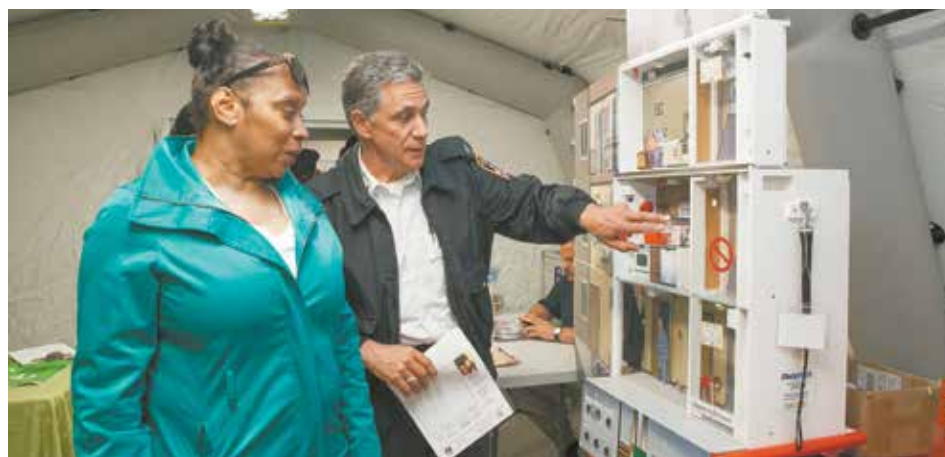
Un residente del residencial Ravenswood Houses aprende sobre medidas de seguridad durante un evento de preparación en caso de un fuego el 5 de junio de 2014.