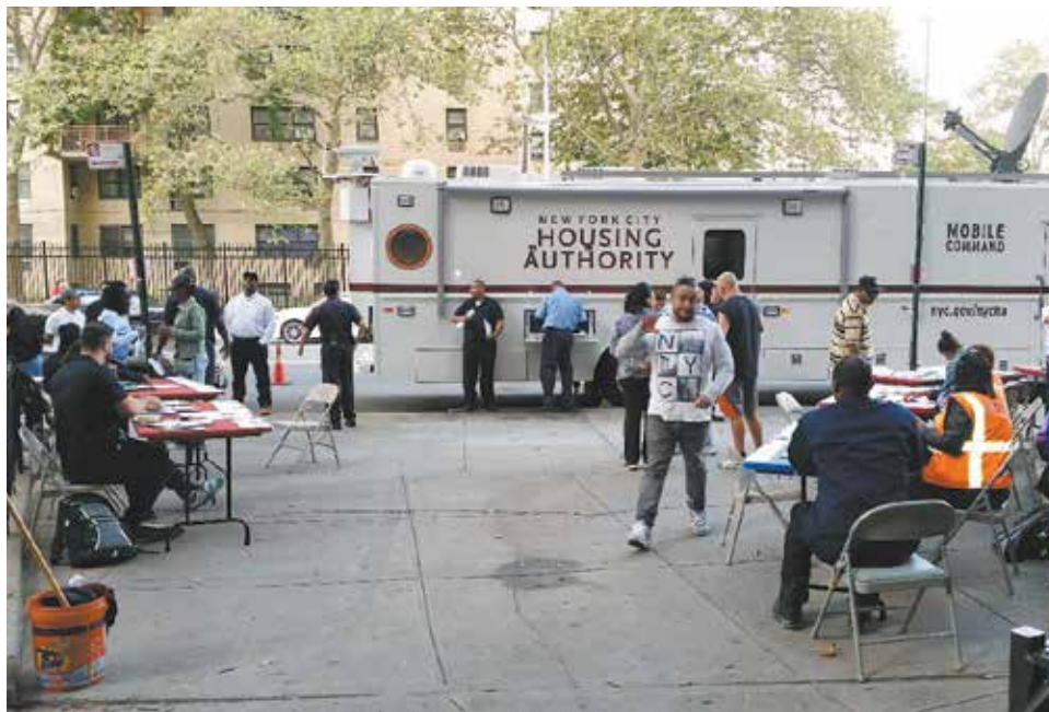
El autobús de Comando de NYCHA estacionado en el residencial Baruch Houses en Manhattan como parte de la Iniciativa de Pedidos de Trabajo de la Oficina de Administración de Propiedades de Manhattan para reducir el tiempo de respuesta en seis residenciales.

L A OFICINA DE Administración de Propiedades de Manhattan (MPM, por sus siglas en inglés) de NYCHA está adoptando un nuevo enfoque para mejorar el tiempo de respuesta para mantenimiento y reparaciones utilizando el autobús de Comando de NYCHA como una oficina centralizadora para gestionar los pedidos de trabajo.