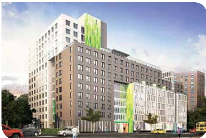
Dumont Commons en Van Dyke Houses

viviendas asequibles en cada residencial. Los residentes tendrán la posibilidad de proporcionar sugerencias sobre las características que quisieran que tuvieran los nuevos edificios. Sus sugerencias se incorporarán al documento de visión de la comunidad para cada edificio, que se entregará a los posibles desarrolladores en la primavera. En los residenciales donde se permita un espacio comercial, los residentes tendrán la oportunidad de sugerir el tipo de negocio que se adecuaría mejor a su comunidad.