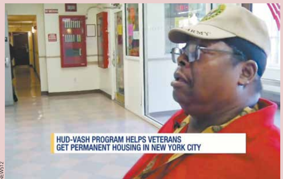
HUD-VASH PROGRAM HELPS VETERANS GET PERMANENT HOUSING IN NEW YORK CITY