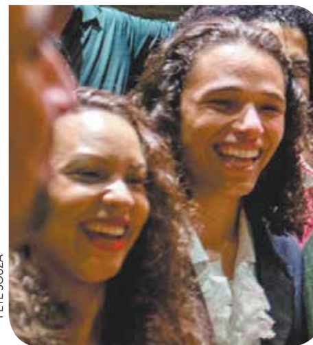
Anthony Ramos (a a derecha) con su antigua compañera de elenco Jasmine Cephas Jones Hamilton castmate Jasmine Cephas Jones.

La última presentación de Ramos en el escenario de Hamilton fue el 20 de noviembre. Pasará a protagonizar la nueva