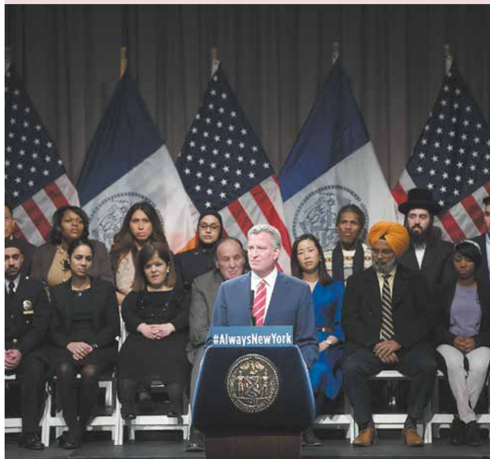
OFFICE OF MAYOR BILL DE BLASIO

Si usted o alguien que usted conozca es víctima de un crimen de odio, llame al 911 de inmediato. Si tiene alguna pregunta sobre crímenes de odio, póngase en contacto con el Grupo de Trabajo de Crímenes de Odio del NYPD llamando al 646-610-5267 y la línea directa sobre crímenes de odio de la Fiscalía de Distrito llamando al 212-335-3100 . Si detecta un problema de seguridad (cerraduras rotas, alumbrado que no funciona, problemas con los ascensores, etc.) hable directamente con la Administración de Propiedades y denuncie el problema mediante la aplicación MyNYCHA o al CCC.